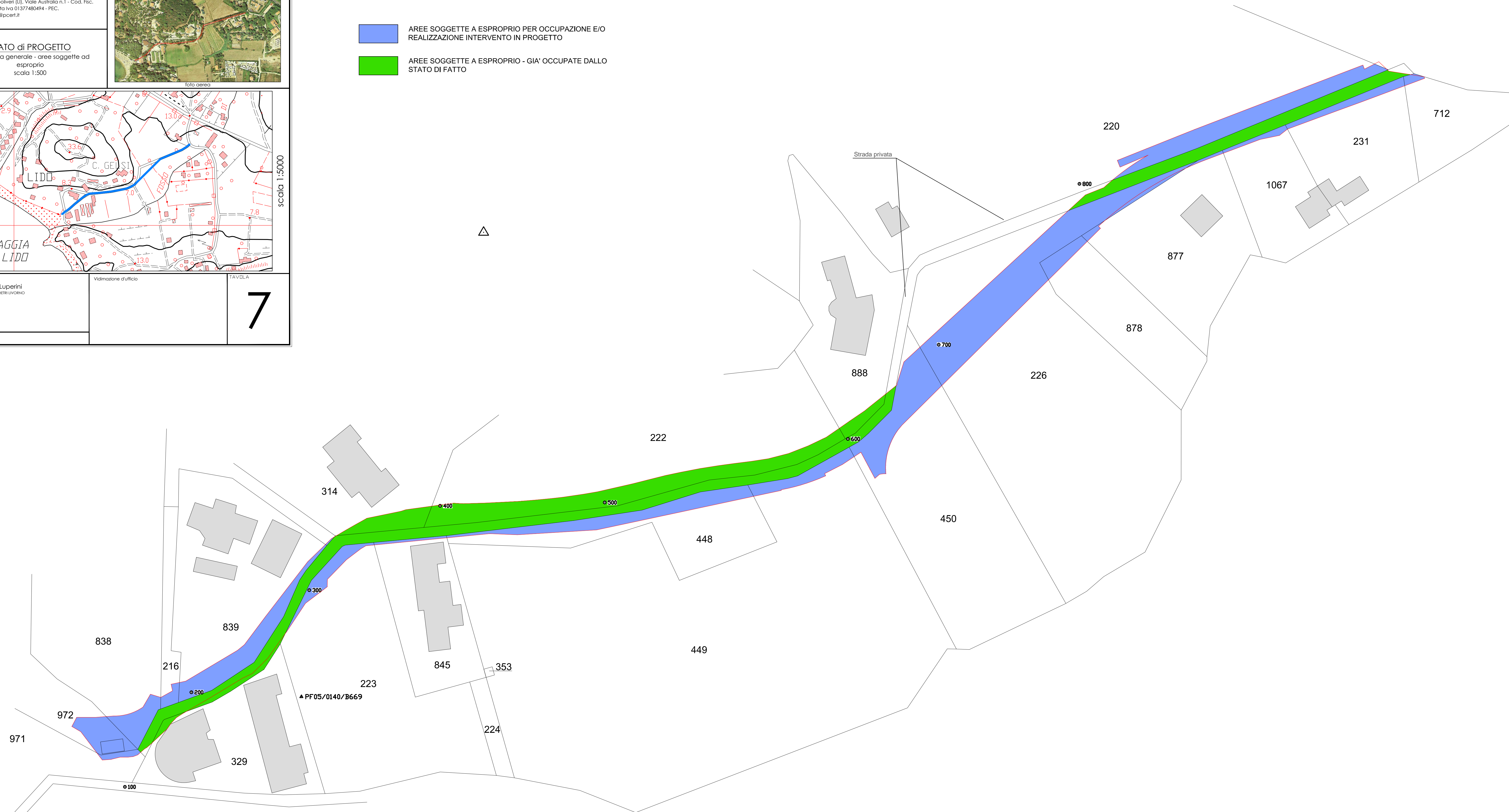
PLANIMETRIA GENERALE - STATO di PROGETTO - AREE SOGGETTE AD ESPROPRIO Scala 1:500